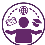
Indsigt i sprog, kultur & traditioner