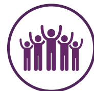
Lokalt og globalt netværk