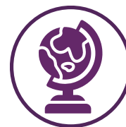
Læring om verdenen og jer selv