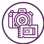
Livslange minder og relationer